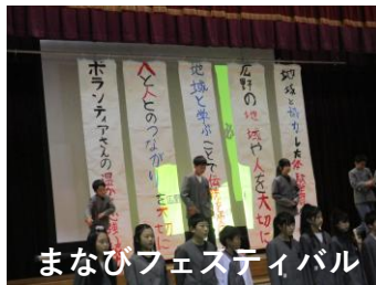
まなびフェスティバル