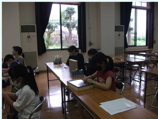
箱を完成させます