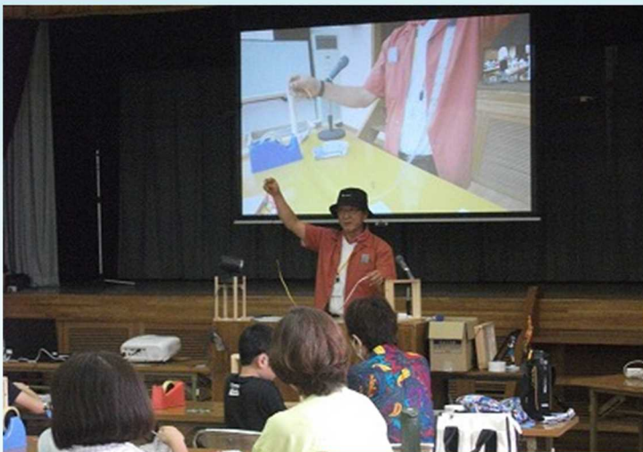
木枠にLEDテープを貼ります