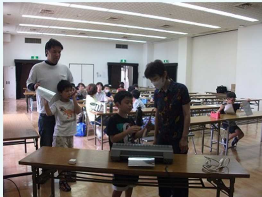
ミラーフィルムをラミネート