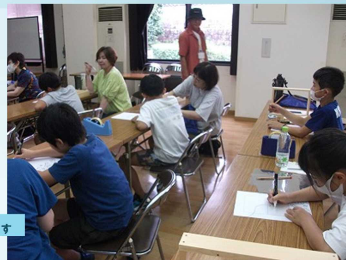
透明な板に好きなイラストを書いて、糸で上から吊します